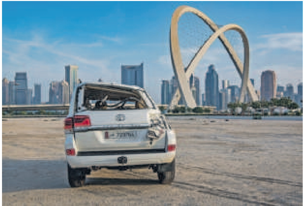
Doha met op de voorgrond een gecrashte Toyota Landcruiser.