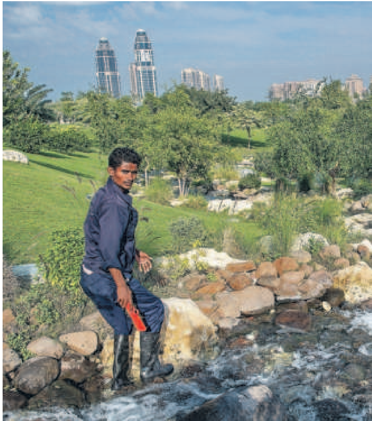
Een Aziatische arbeider poetst de stenen in een aangelegd park in Doha.

MILJOEN euro minimaal hebben in elk geval negentien Nederlandse pensioenfonds uitstaan in Qatarese staatsobligaties. Het daadwerkelijke bedrag moet aanzienlijk hoger zijn.