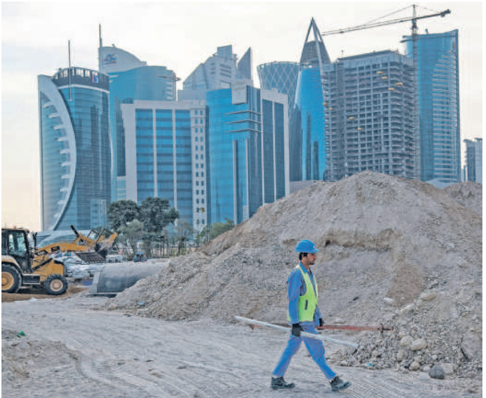
Een gastarbeider uit Azië op een van de vele bouwterreinen in Doha, de hoofdstad van Qatar. De arbeidsomstandigheden van veel bouwvakkers zijn slecht.

Hoogveenherstel of natuurverwoesting in de Deurnsche Peel?