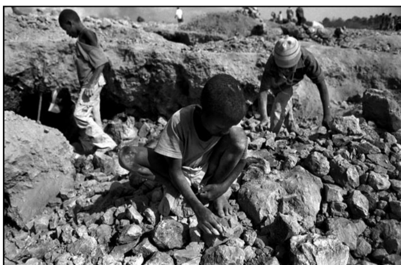
Foto uit de serie Portretten uit Katanga, in opdracht van Fatal Transactions.

Ondertussen moeten lokale gemeenschappen en de natuur wel wijken voor grote dagbouw-mijnen die vaak water en lucht in de wijde omgeving ernstig vervuilen. De mijnwerkers werken onder zware en gevaarlijke omstandigheden, vaak tegen lage lonen en met weinig arbeidsrechten. HIV en andere infectieziekten verspreiden zich snel in mijnwerkersbarakken. En de winning van minerale grondstoffen is vaak een bron van conflicten en corruptie. Voor verschillende opdrachtgevers, waaronder het Nederlands instituut voor Zuidelijk Afrika (NiZA), maakt Profundo