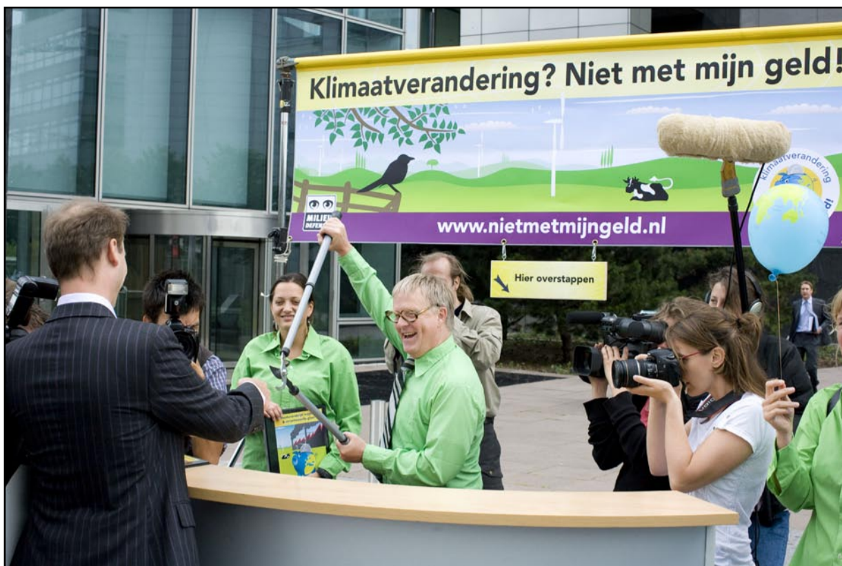
Milieudefensie knipt symbolisch bankpasjes doormidden voor de deur van ABN Amro

Voor Milieudefensie onderzocht Profundo welke bedragen de vier grote Nederlandse bankgroepen - ABN Amro, Fortis, ING en Rabo - en twee duurzame banken - ASN en Triodos - steken in verschillende vormen van energieproductie. De grote banken bleken vele malen meer te investeren in producenten van olie, gas en kolen dan in producenten van duurzame energie. Met de productie van