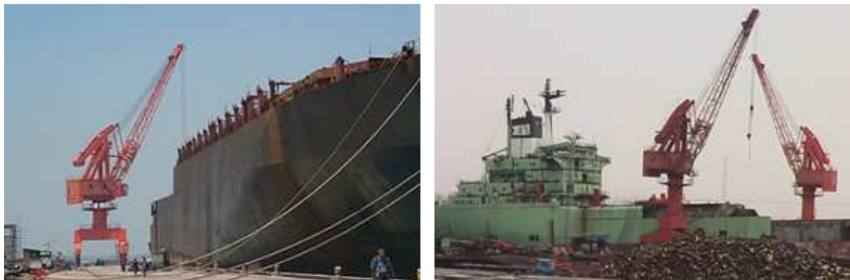
Werk van scheepssloperij in China, Website Changjiang Ship-Breaking Yard ( www.cjshipbr.com ), bezocht in september 2012.

In China zijn de nodige investeringen gedaan en de situatie in China is daardoor technisch vergelijkbaar met werven in OECD landen. Stichting De Noordzee vindt dat de goede sloopwerven in China daarom gepromoot zouden moeten worden. 19